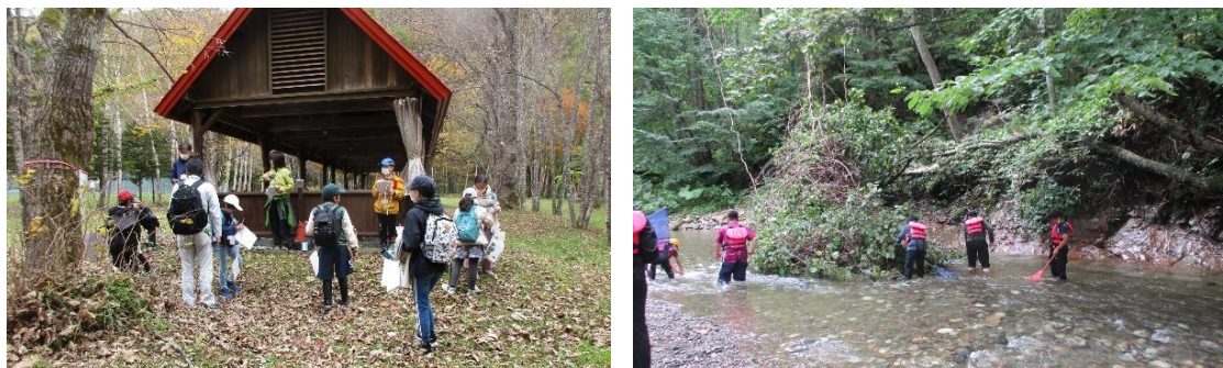
連携事業：「レンジャーさんから日高山脈を教わろう！キッズプログラム」の様子

帯広市では日高山脈の多様な自然の保護強化や、知名度の向上、地域資源として活用を図るため、日高山脈襟裳国定公園の国立公園指定に向け、関係自治体との連携事業や要望活動を行ないました。