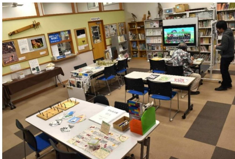
アイヌ民族文化情報センター「リウカ」

帯広市ではアイヌ民族の伝統的な文化や歴史について学ぶことのできるアイヌ民族文化情報センター「リウカ」の設置や、身近な自然をアイヌ文化の視点で紹介する自然観察会などを開催しています。