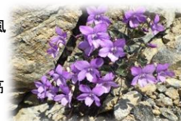
アボイタチツボスミレ

日高山脈が国立公園に！ 身近でいつも見ている日高山脈 が日本を代表する傑出した自然風 景地として国立公園に指定される こと、日本の自然公園のしくみや 日高山脈の成り立ちや特色、日高 山脈と私たちのつながりを学ぶ。