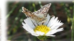
ヒメチャマダラセセ