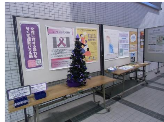
■ 女性に対する暴力をなくす運動 パネル展