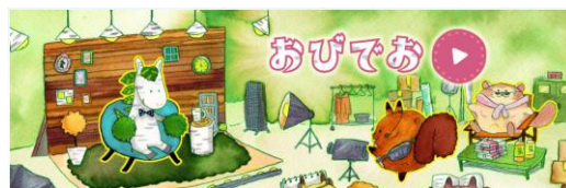
■帯広市公式YouTubeチャンネル「おびでお」