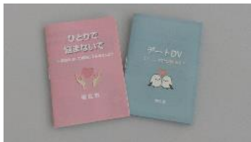
■ 困難女性支援パンフレット デートDV予防パンフレット