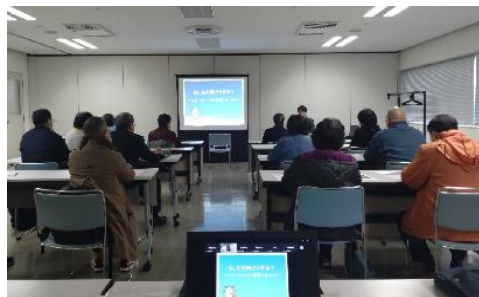
■ DV防止講座・デートDV予防講座