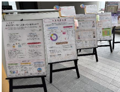
■男女共同参画コーナー