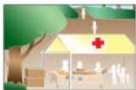
災害時の避難場所