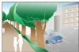
大気汚染の浄化・騒音抑制