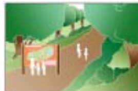
自然とのふれあい