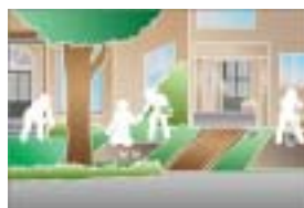
豊かな地域づくり