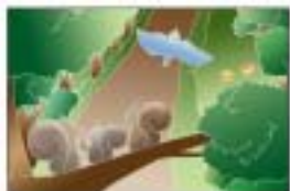
生物の生息・生育環境を保全