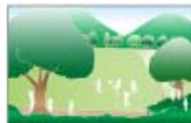
スポーツ・レクリエーション活動