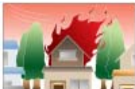
火災の延焼防止・遅延