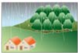
流量の調整や洪水の防止