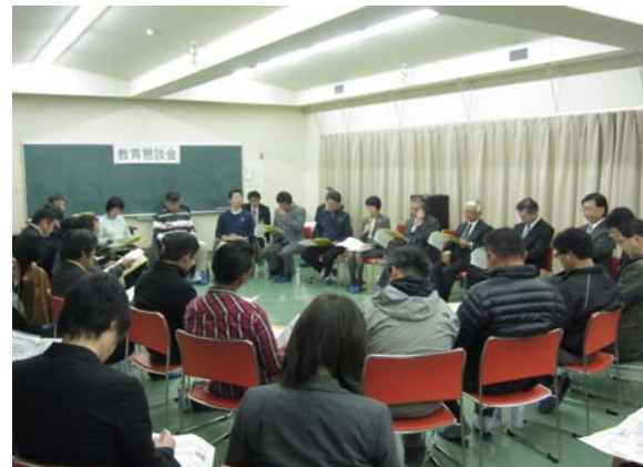
川西農業者研修センター(H27.11.4)

★(お問い合わせ先)帯広市教育委員会 学校教育部 企画総務課 電話65-4201