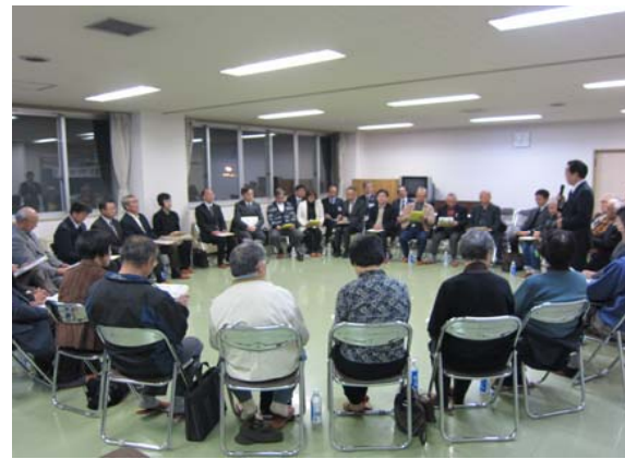
西帯広コミュニティセンター(H27.11.25)