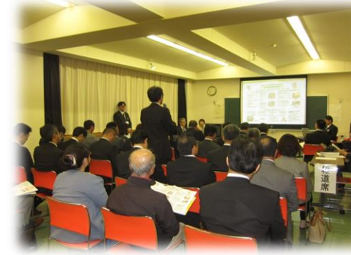
(R1.10.15 川西農業者研修センター)

お忙しい中、お越しいただきまして、誠にありがとうございました。 いただいたご意見は、今後の教育行政の参考とさせていただきます。