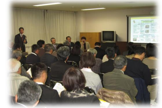
(R1.11.11 西帯広コミュニティセンター)