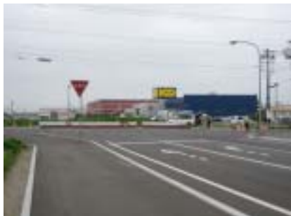
① 青柳通（整備中）と豊成通の交差点