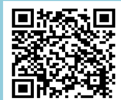
住宅の補助・支援