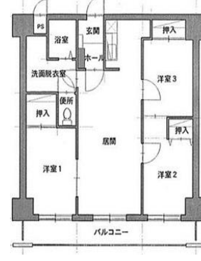
センターパーク201号室