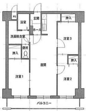
センターパーク601号室