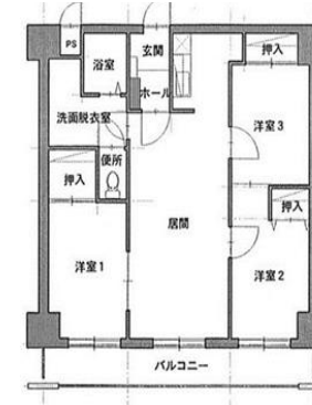
センターパーク401号室