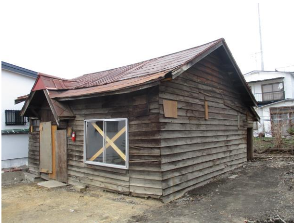
例1 建物全体の傾斜による特定空家等の認定

主として居住の用に供される建築物または建築物の部分で、その構造または設備が著しく不良であるため居住の用に供することが著しく不適当なものをいいます。