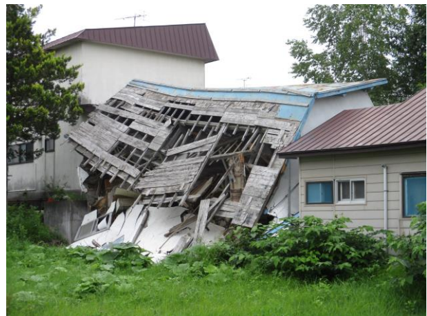
例2 倒壊による特定空家等の認定