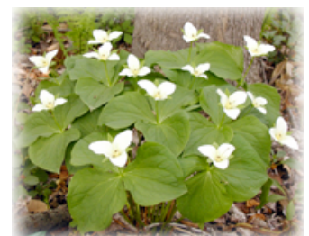
オオバナノエンレイソウ

晴れた日には、帯広の森に行って、暖かな陽の光を浴びながら、森のなかをのんびり散策してみませんか？