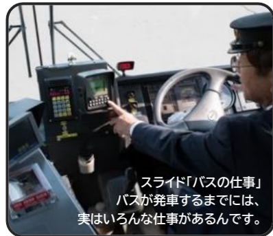
スライド「バスの仕事」 バスが発車するまでには、実はいろいろな仕事があるんです。