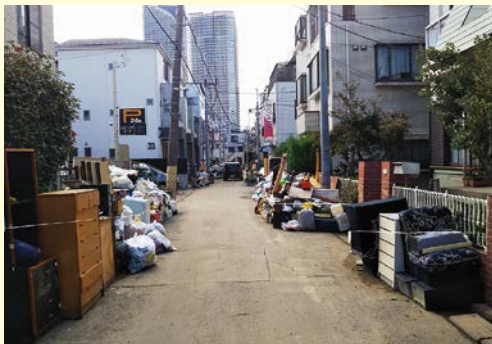
路上に混合状態で堆積した災害廃棄物