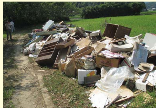
公園等に混合状態で堆積した災害廃棄物