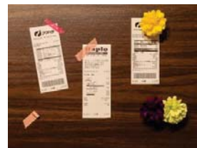
献立を考えるときの参考に

予定変更で余った食材など、冷蔵庫の中を把握するのが難しいこともあります。冷蔵庫メモを作ったり、レシートを貼って使用したものを消していくだけでも、食品の無駄を防ぐのに効果的です。スマートフォンの在庫管理アプリなどもあるので、自分に合った方法で取り組んでみましょう。