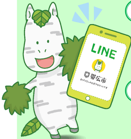
白樺の妖精ばんば しらかんば