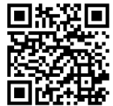
大型ごみインターネット 受付のページ