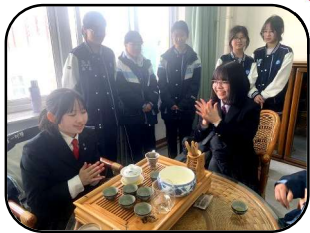
朝陽高校生と茶芸体験