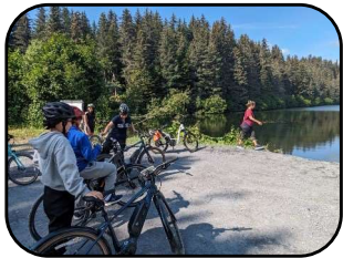
電動自転車サイクリング