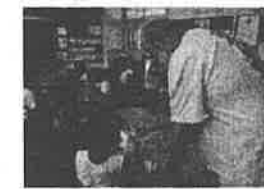
夏休み期間中の「サマーイングリッシュ」の様子