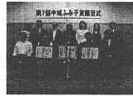
第7回中城ふみ子賞贈呈式