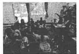
出前環境教室の実施 (真剣に説明を聞く児童の様子)