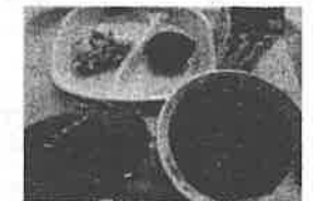
地産地消に取り組む学校給食 (地産産食材を使った給食)