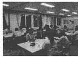
こども学校応援地域基金プロジェクト（「こども応援！みらいカフェ」の様子）