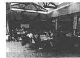
家庭教育学級（学級生交流会の様子）