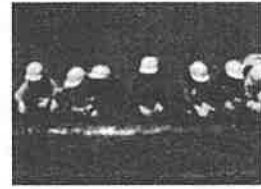
ふるさと学習農園（畑に種芋を植えている様子）