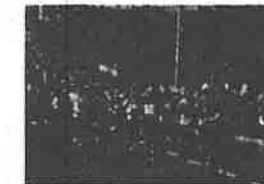
2016フードバレーとかちマラソン