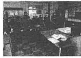
帯広南商業高校でのキャリア教育 (模擬面接の様子)