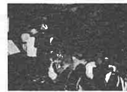
百年記念館でのボランティア活動（常設展示室での小学生への展示解説）