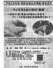
市民大学講座 (講座のパンフレット)