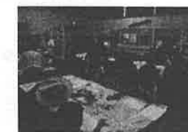
四館連携事業「よりどりみどりがおかフェスタ！」の様子（新教育委員会制度の構図）