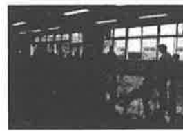
子どもの居場所づくり事業 (放課後子ども広場「空手教室」)