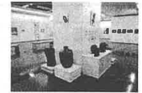
第13回北の構図展の開催