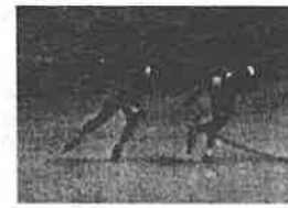
冬季アジア札幌大会 帯広会場でのスピードスケート競技（大歓声に沸いた競技会場）