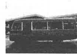
スクールバスの更新（新しくなったスクールバス）