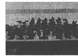
札幌交響楽団特別演奏会の開催