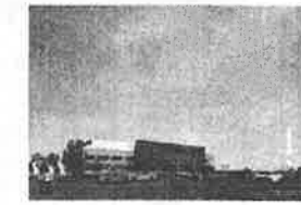
新総合体育館の建設（新総合体育館のイメージ）