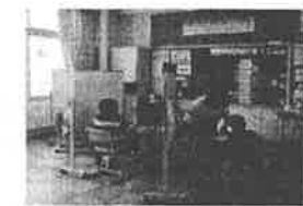
特別支援教育の充実（知的学級の様子）