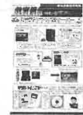
クラウドサーバーの概要を教職員へ伝える広報誌「教育情報」