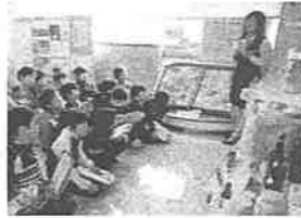
くりりんセンター見学の様子