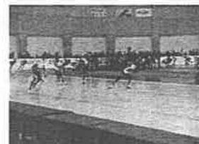
ワールドカップスピードスケート競技会マスキートの様子