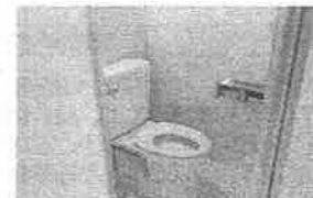
洋式化修繕を実施したトイレ