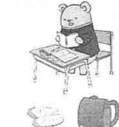
特別支援学級の授業の様子