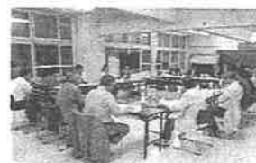
大空中学校適正規模の確保等 地域検討委員会の様子