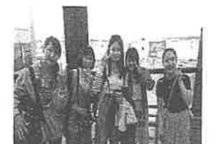
マディソン市へのホームステイ体験の様子