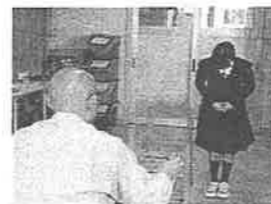
面接の基本指導の様子