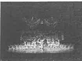
市民バレエ公演「コッペリア」