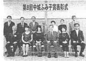
第8回中城ふみ子賞表彰式