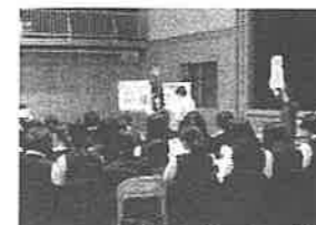
デートDV予防講座の様子