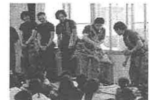
生産者の学校訪問の様子