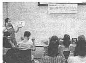
語り手育成講習会(入門編)の様子