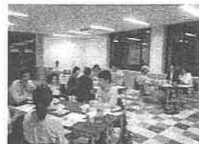
ボランティア同士のつながりを深める「こども応援！みらいカフェ」の様子