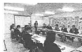
おびひろ動物園魅力アップ 検討委員会の様子