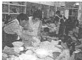
「親子陶芸教室」の様子