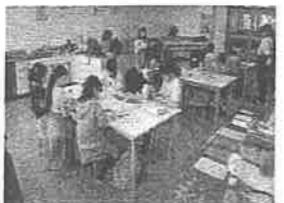
放課後子ども広場の様子（カーネーションづくり）