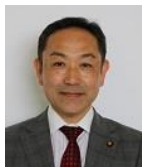
③ 13番 藤澤昌隆議員 (公明党 代表)